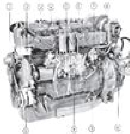
Fig. 4 Engine engine, TAMD60

The fuel system is well protected from interruptions during running by means of effective, bypassable fuel filters. On the TAMD60 engines the fuel injection pump is fitted mounted onto the other engine from the pump fitted in a block.